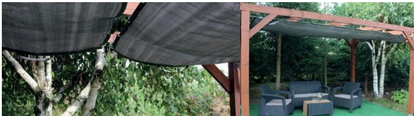
Afbeelding 1: Rolluiken op een constructie