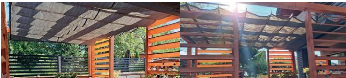
Afbeelding 1: Rolluiken op een constructie