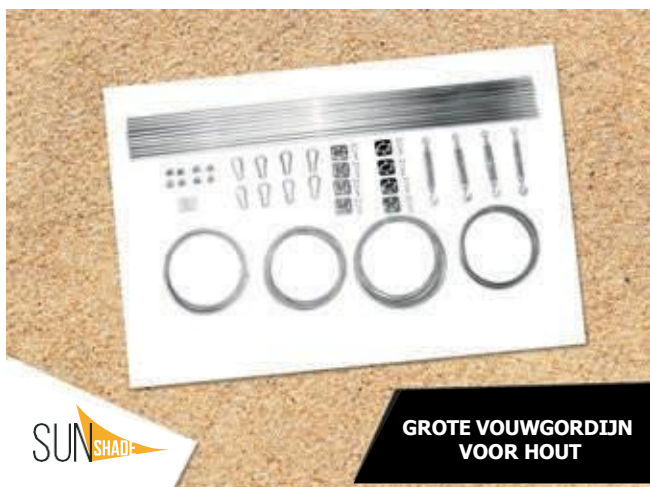
GROTE VOUWGORDIJN VOOR HOUT