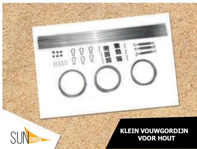
KLEIN VOUWGORDIJN VOOR HOUT

HOUTSET GROOT - MEER DAN 10M 2 , SMALL - MEER DAN 5M 2 , MINI - MINDER DAN 5M 2