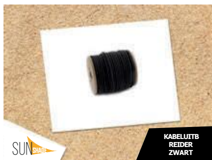
KABELUITB REIDER ZWART