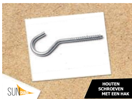
HOUTEN SCHROEVEN MET EEN HAK