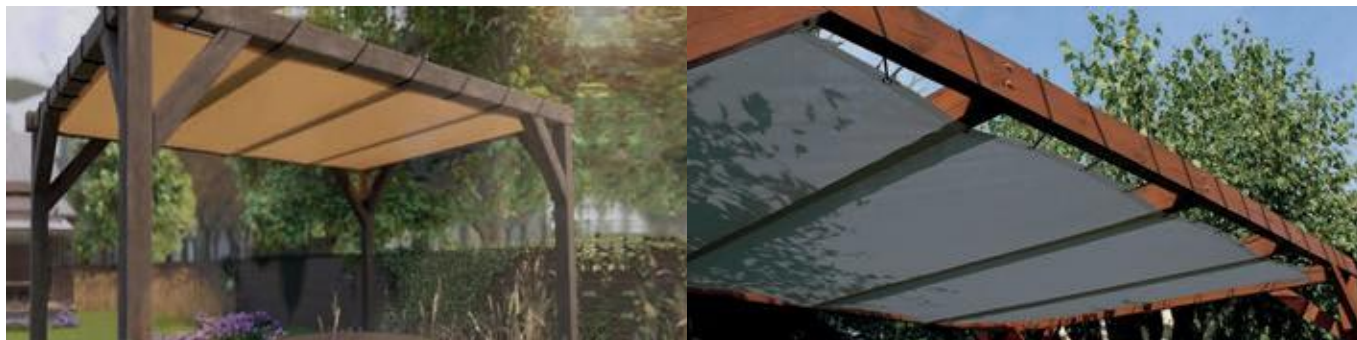
Afbeelding 1: Zeildak op een constructie