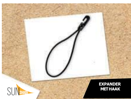
EXPANDER MET HAAK