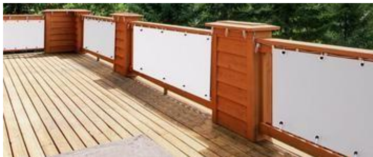
Afbeelding 1 Balkondekking