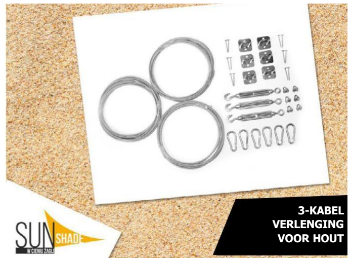
3-KABEL VERLENGING VOOR HOUT