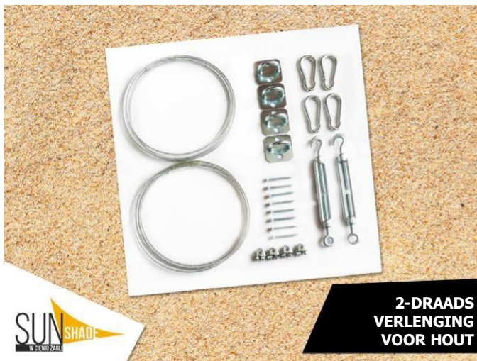
2-DRAADS VERLENGING VOOR HOUT