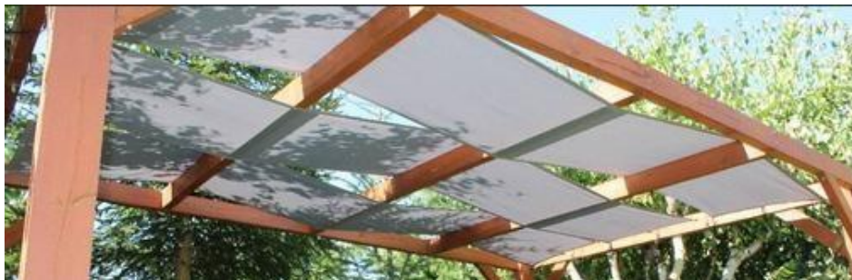
Afbeelding 1: Gazebo/Romaanse stroken in Premium Decor-materiaal