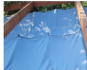
Figuur 1c. Top van zeil uitschuifbaar op 3 lijnen