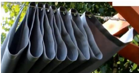
Figuur 1b. Uitschuifbaar zeil op 2 lijnen