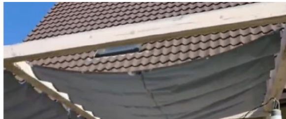
Figuur 1b. Schuifzeil op 2 lijnen