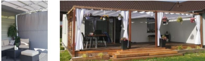
Figuur 1. Booggordijn a) ingeschoven b) uitgeschoven