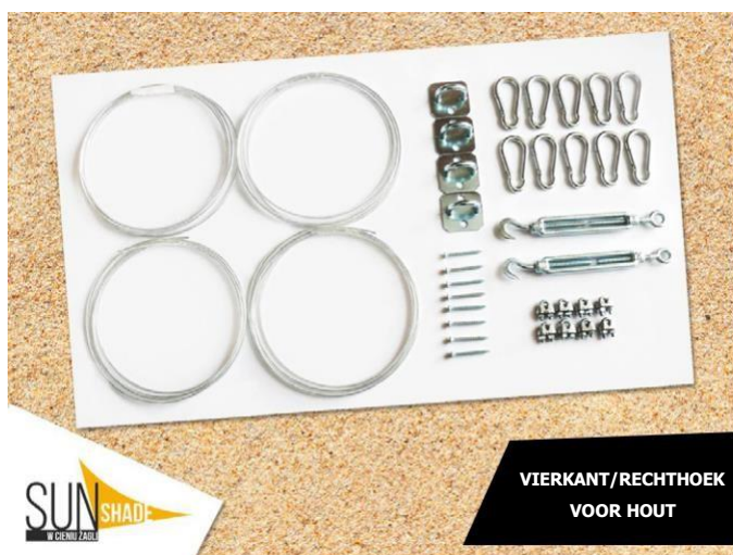
VIERKANT/RECHTHOEK VOOR HOUT