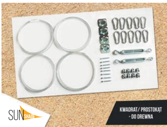
KWAADRAT/ PROSTOKĄT - DO DREWNA