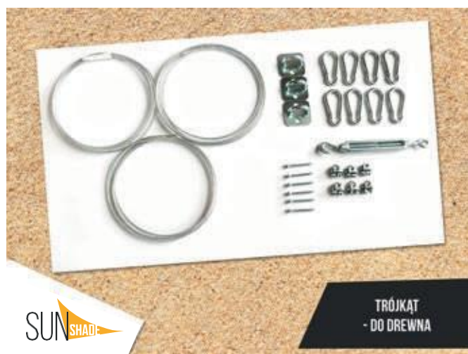
TRÓJKĄT - DO DREWNA