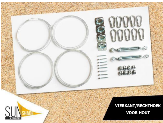
VIERKANT/RECHTHOEK VOOR HOUT