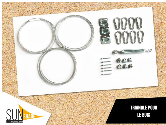
TRIANGLE POUR LE BOIS