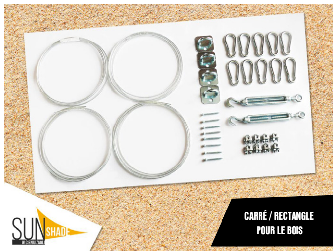
CARRÉ / RECTANGLE POUR LE BOIS