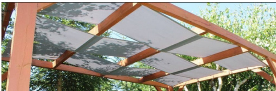
Fig. 1 Bandes gazébo/romaines en Premium Decor