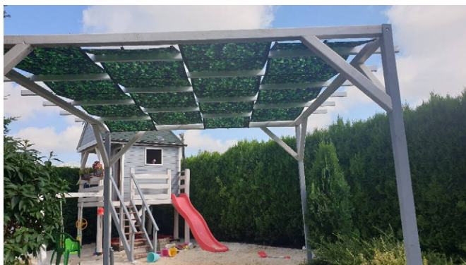
Fig. 1 Bandes gazébo en decor avec impression unilatérale