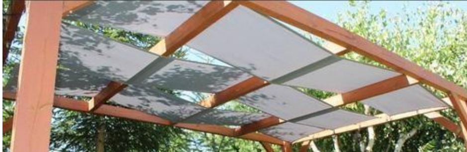
Figura 1: Gazebo/tiras romanas en material Premium Decor