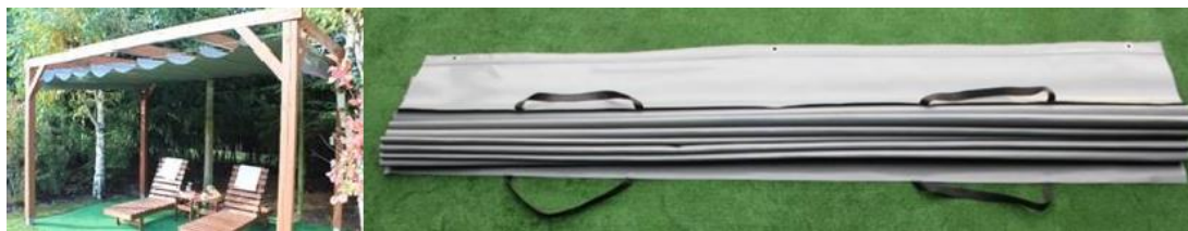
Figura 1. Persiana romana (a) sobre estructura de madera (b) plegada para su almacenamiento