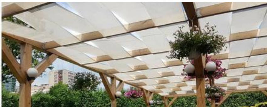
Figura 1: Franjas arbóreas en la estructura.