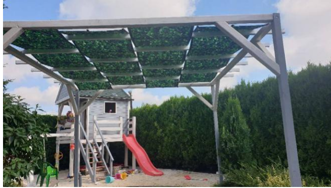
Figura 1: Tiras de cenador de material decorativo con impresión a una cara.