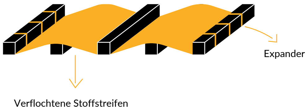
Abb. 2. Vorgeschlagene Methode zur Installation dieses Sonnenschui