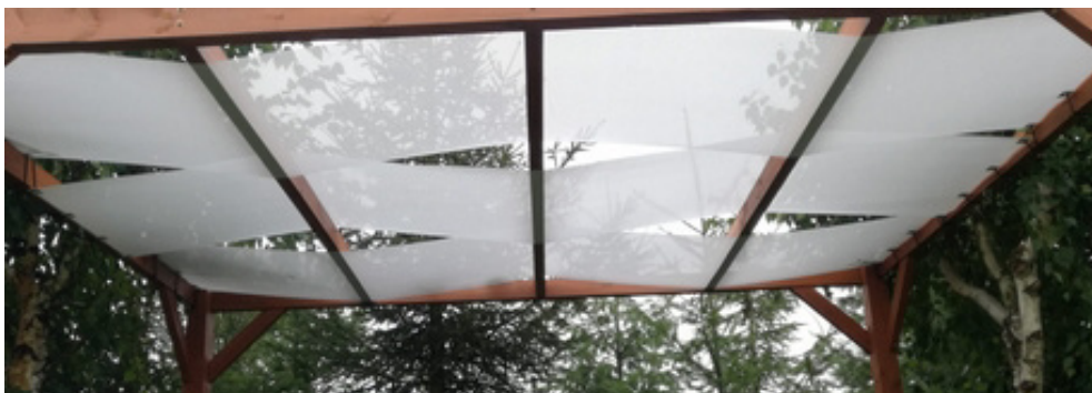
Abb. 2. Vorgeschlagene Methode zur Installation dieses Sonnensch