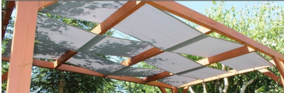
Abb. 1. Sonnenschutz ohne Seilspanntechnik als Stoffstreifen und -bahnen aus Premium-Dekor