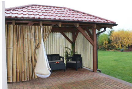
Abb. 1. Pavillon-Vorhang