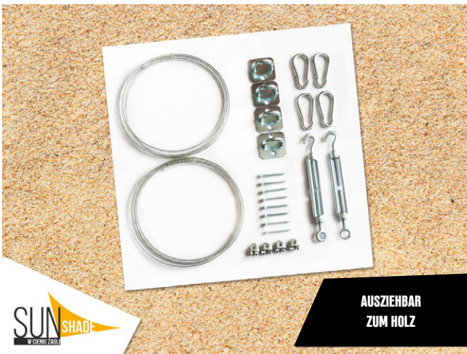
AUSZIEHBAR ZUM HOLZ