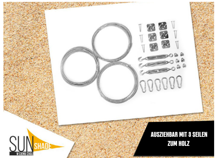
AUSZIEHBAR MIT 3 SEILEN ZUM HOLZ