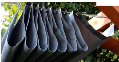
Abb. 1a. Zusammengerolltes Sonnensegel mit sichtbarer Befes