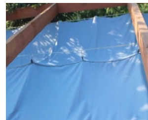
Abb. 1c. Oberseite des aufrollbaren Sonnensegels auf 3 Seilen