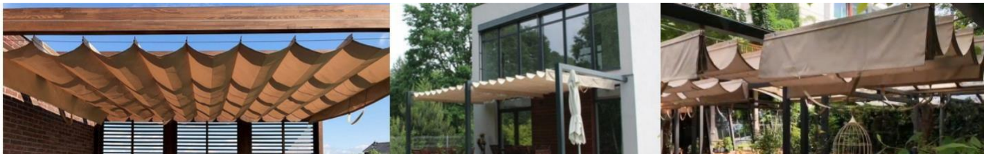
Obrázek 1: Římská roleta a) na dřevěné rámové konstrukci b) na ocelových příčnicích c) na kovové konstrukci