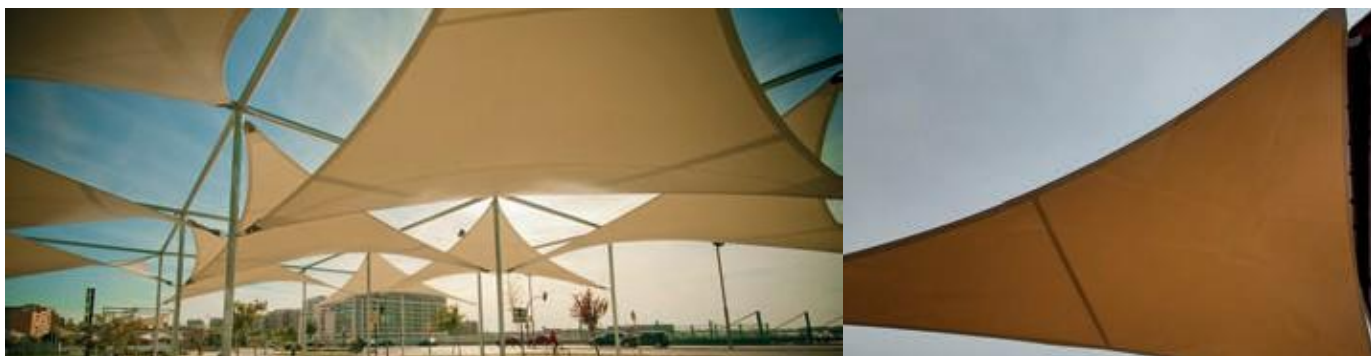
Obrázek 1: Průmyslová plachta na konstrukci